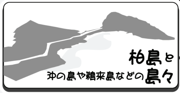
柏島と 沖の島や鶴来島などの島々