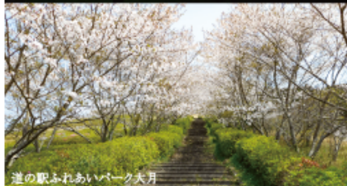
道の駅ふれあいパーク大月