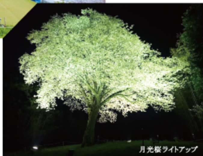
月光桜ライトアップ