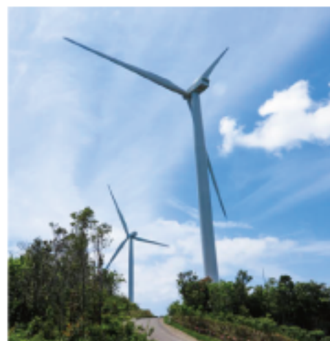
[写真] 大洞山ウィンドファーム…11基の総出力は33,000kw(1基あたり3,000kw)。これは一般家庭の約20,000世帯分の発電量となる。

今後の開放日は協会窓口ホームページなどでご案内させていただきます。その際、誓約書をご記入いただくことで発行される通行証を持参いただければスムーズに見学していただけます。ぜひご利用ください。