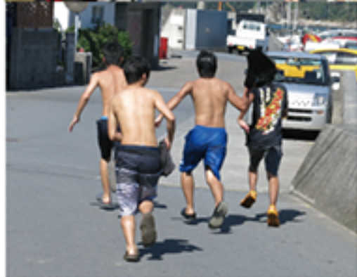
上…沢山のテントの花が咲く 竜が浜キャンプ場。 左…ダイビング客などで賑わう柏島 島内の夏の定番のワンシーン。